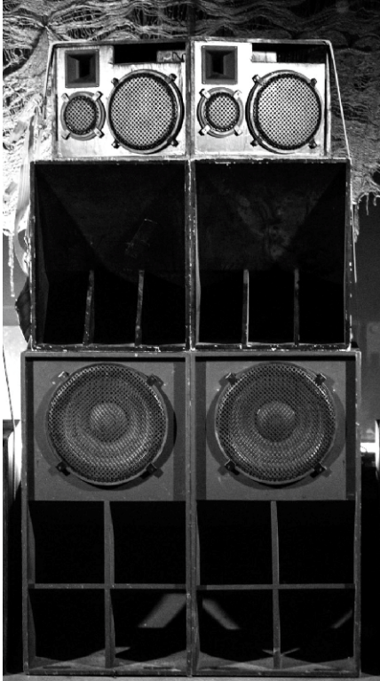
Sandokan hifi soundsystem