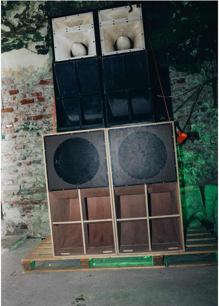
Rebel station soundsystem