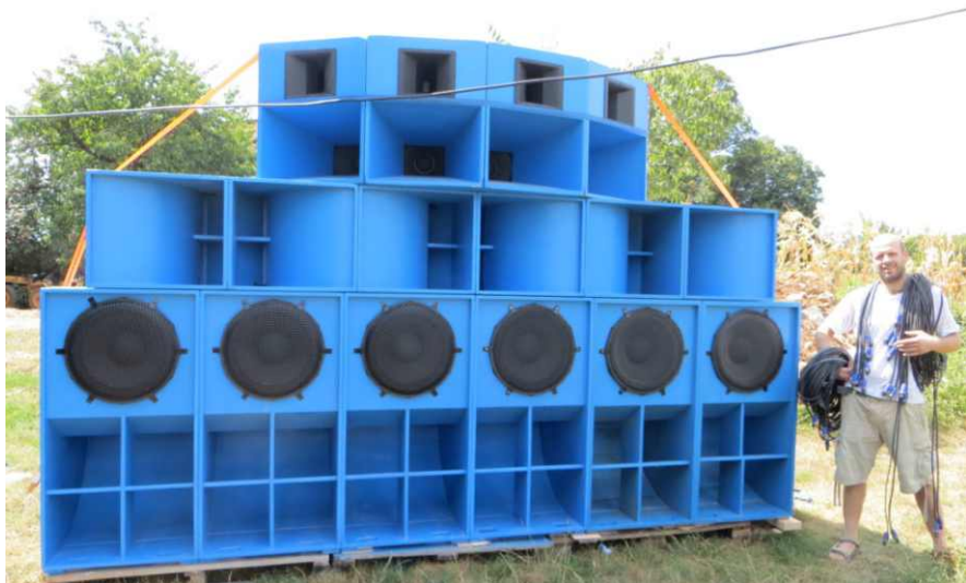
Vibration addict soundsystem