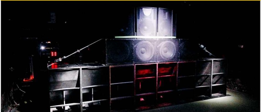
Kordoom Hifi soundsystem